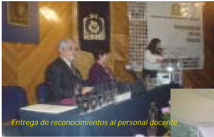
Entrega de reconocimientos al personal docente