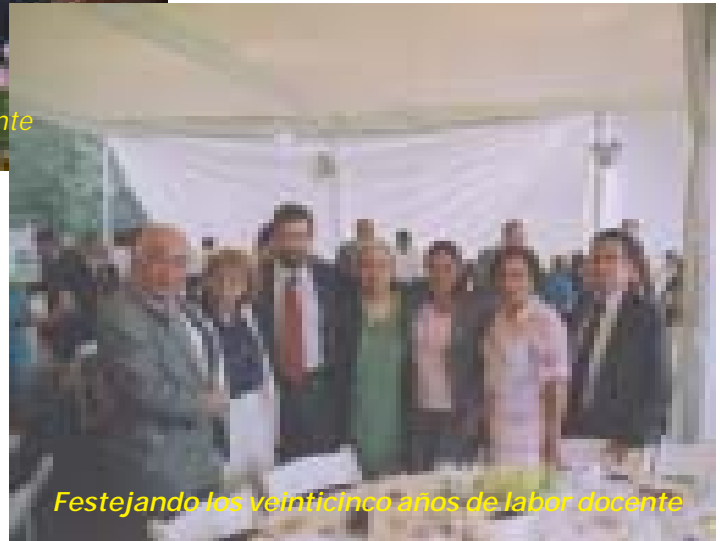
Festejando los veinticinco años de labor docente