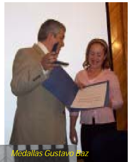
Medallas Gustavo Baz