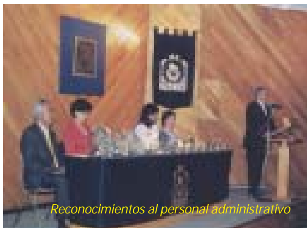
Reconocimientos al personal administrativo