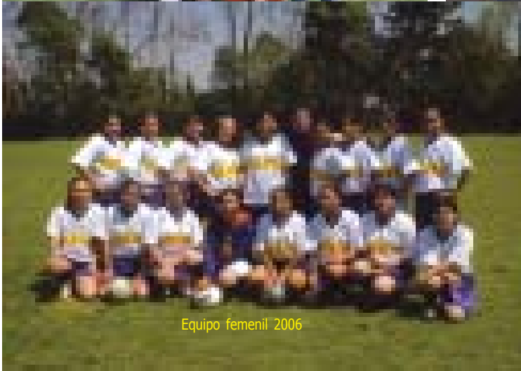
Equipo femenino 2006