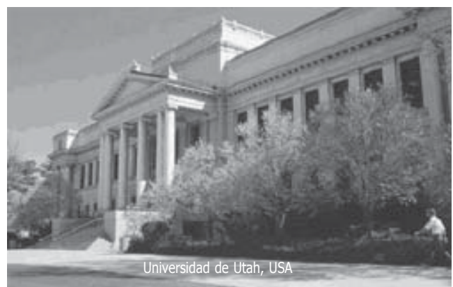
Universidad de Utah, USA