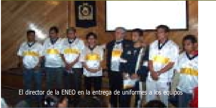
El director de la ENEO en la entrega de uniformes a los equipos