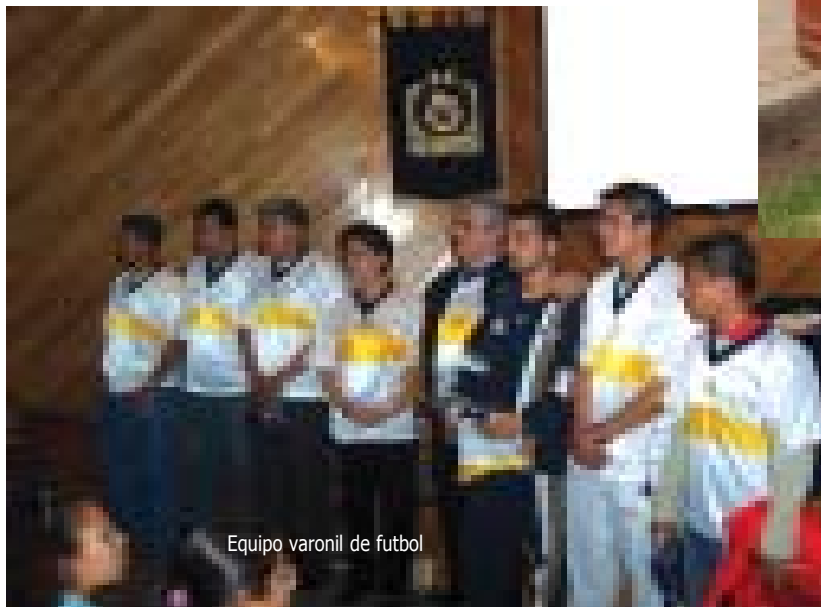
Equipo varonil de futbol

varonil de la ENEO. Desde esta tribuna de expresión quiero hacerle un reconocimiento público y brindarle mi agradecimiento por continuar en nuestro equipo y decirle que esperamos su pronta recuperación.