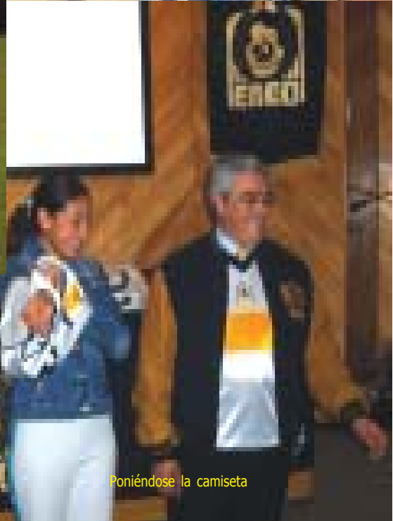
Poniéndose la camiseta