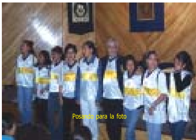
Posando para la foto

Gracias a todos los alumnos que se pusieron la camiseta de Enfermería, al apoyo incondicional de la Dirección, a los académicos que apoyaron a sus alumnos y al personal administrativo que colaboró con nosotros