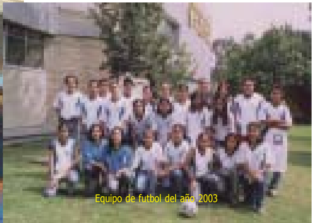
Equipo de fútbol del año 2003