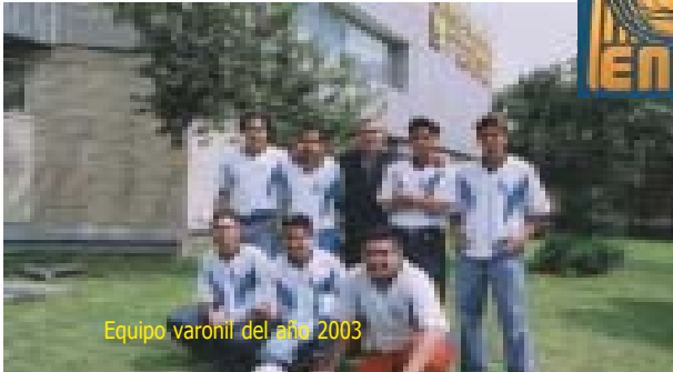
Equipo varonil del año 2003