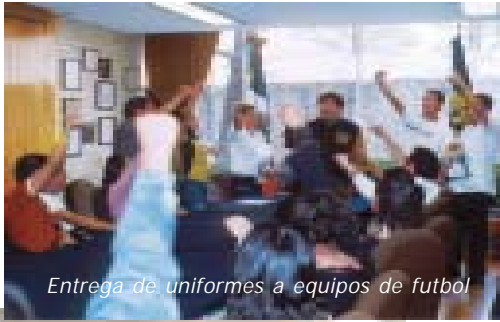
Entrega de uniformes a equipos de futbol