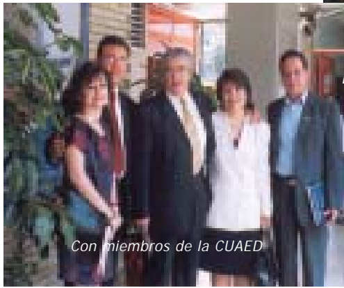
Con miembros de la CUAED