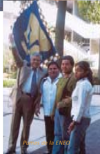
Pumas de la ENEO