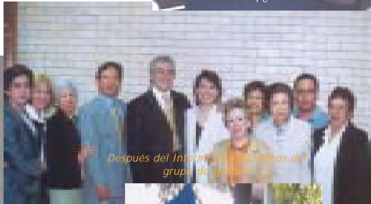
Después del Informe con miembros del grupo de gestión