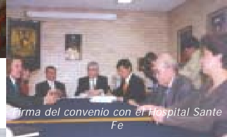
Firma del convenio con el Hospital Sante Fe