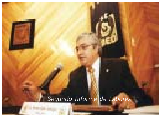
Segundo Informe de Labores