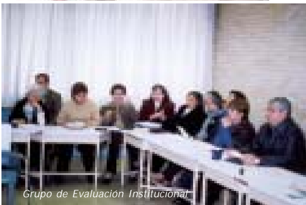
Grupo de Evaluación Institucional