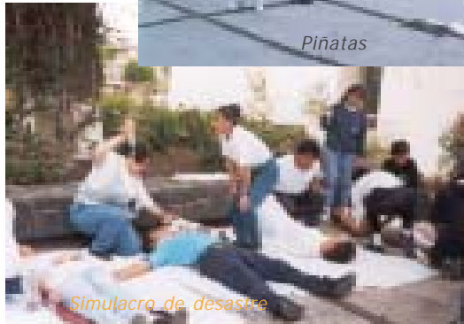
Simulacro de desastre