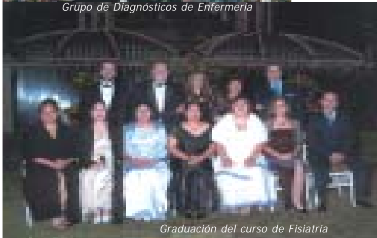
Graduación del curso de Fisiatría