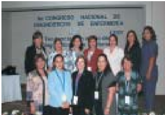
Grupo de Diagnósticos de Enfermería