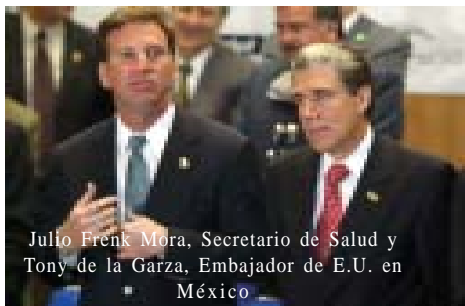
Julio Frenk Mora, Secretario de Salud y Tony de la Garza, Embajador de E.U. en México