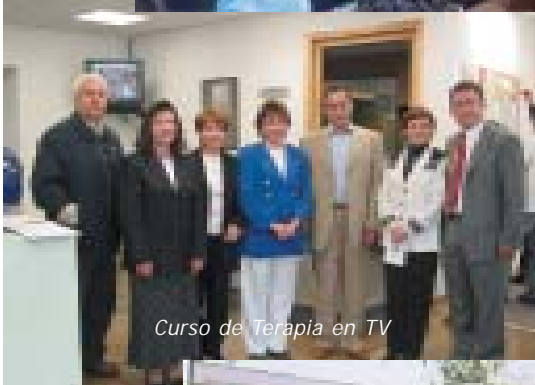
Curso de Terapia en TV